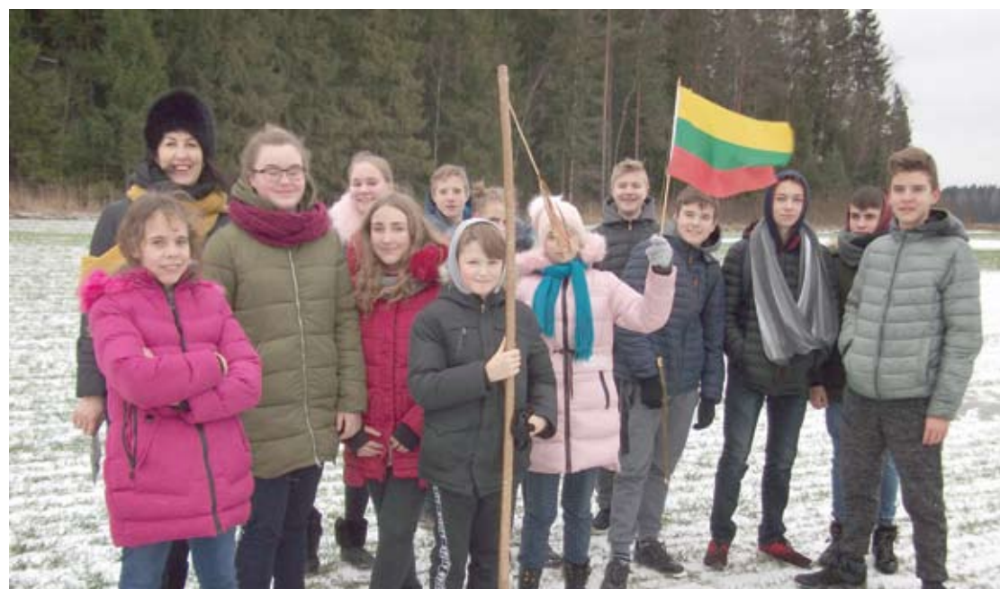
Stabtelėjimas žiemkenčiais žaliuojančiuose Palaukiškių laukuose.