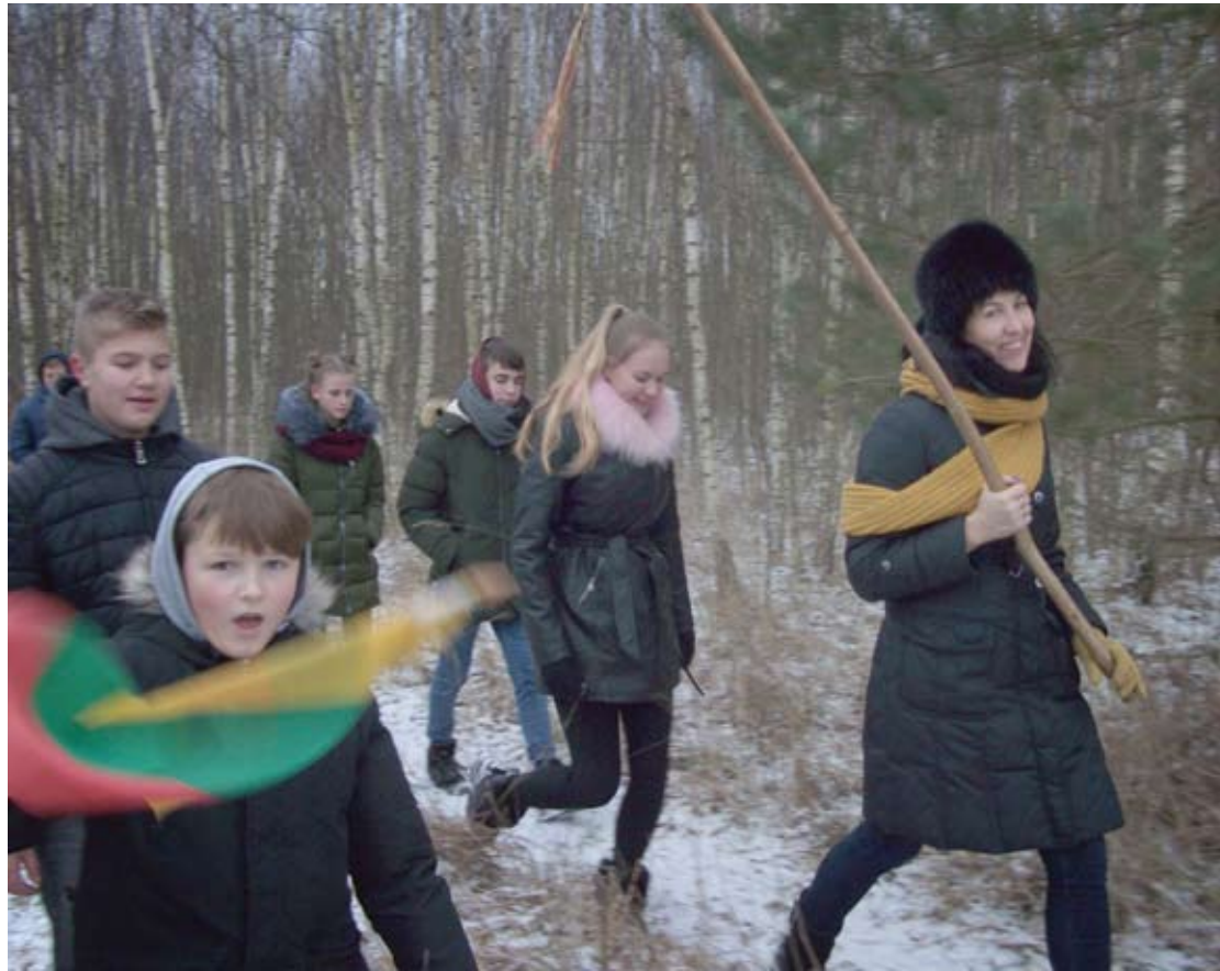
Mažytė trispalvė, lazdyno lazda ir žygio smagumas...