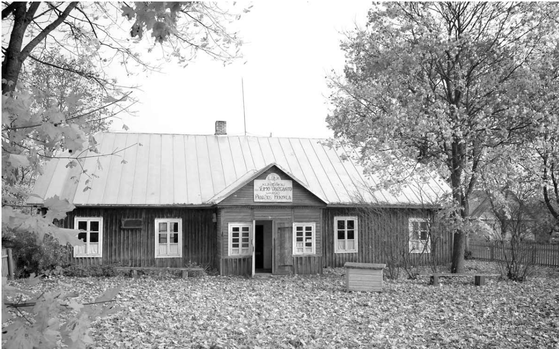
Prieš daugiau kaip tris dešimtmečius restauravus buvusios Kunigiškių pradžios mokyklos pastatą buvo įkurtas kolūkinis muziejus, Atgimimo metais tapęs Svėdasų krašto (Vaižganto) muziejumi.

Nors šviesios atminties Onos Sedelskytės darbinė ir kūrybinė veikla, gyvenimo keliai nebuvo susieti su Svėdasų kraštu, tačiau dovana šiam sodžiaus muziejui tikrai praverčia.