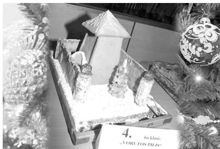
Aukcione buvo galima įsigyti ir Vorutos pilį.