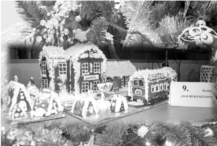
Aukcione parduotas meduolis, vaizduojantis siaurojo geležinkelio stotį.